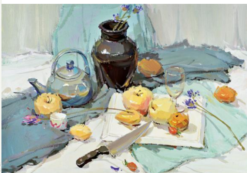
色彩写生——水粉或水彩